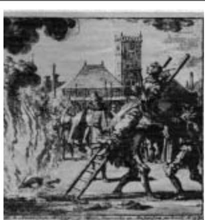
Hunderttausende Frauen, Männer, Kinder, Tiere fielen dem Wahn zum Opfer.

arbeitet, geht auf die Weltanschauung eines René Descartes zurück, der der Auffassung war: Wenn Tiere Schmerzlaute äußern, so ist dies mit dem Quietschen einer Tür vergleichbar; es ist ein