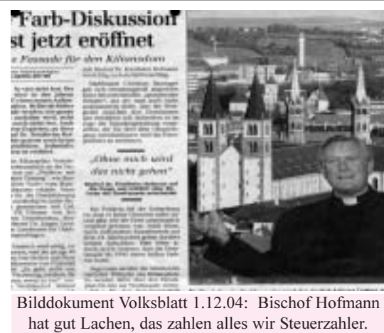
Bilddokument Volksblatt 1.12.04: Bischof Hofmann hat gut Lachen, das zahlen alles wir Steuerzahler.

den fehlt schlicht und einfach das Geld, um sich "freizukaufen". Dabei ginge es viel leichter: Der Staat könnte einfach die "historische" Baulast von sich aus beenden. Wenn sie jemals einen Sinn gehabt haben sollte, dann wäre dieser auf jeden Fall längst hinfällig. In einem Staat, in dem nur noch eine verschwindende Minderheit der Bürger (ca. 5%)