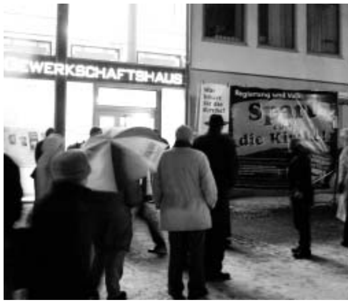
Demonstration vor verschlossenen Türen

Im Januar dieses Jahres wurde im Gewerkschaftshaus am Paradeplatz ein Veranstaltungsraum reserviert, in dem ein bekannter Theologe und ein Vertreter des Bundes für Geistesfreiheit über die finanzielle Verflechtung zwischen Staat und Kirche sprechen wollten. Diese Verflechtung führt bekanntlich jährlich zu einer milliardenschweren Subventionierung der Kirchen aus allgemeinen Steuergeldern. Deshalb sollte für die Veranstaltung mit dem Appell „Spart euch die Kirche!“ geworben werden – ein Slogan, dem viele Zeitgenossen ohnehin längst folgen, indem sie der Kirchenbürokratie den Rücken kehren. Doch wohlgemerkt: Es ging nicht um die Kirchensteuer der Kirchenmitglieder, sondern vor allem um die jährlich 14,15 Milliarden Euro Subventionen, welche der Staat, das heißt wir, alle Bürger, zusätzlich für die katholische und evangelische Kirche aufbringen müssen: für Bischofs- und Pfarrergehälter, für Priesterausbildung, für konfessionellen Religionsunterricht, Militärseelsor-