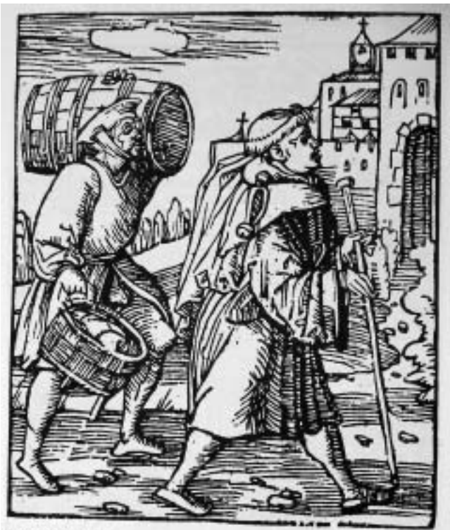
Ein Bauer begleitet den Mönch mit den fälligen Abgaben ins Kloster.

Alexander VI. Cesare bringt höchstwahrscheinlich sogar seinen eigenen Bruder, den Papstsohn Pedro, um, ebenso wie seinen Schwager, den neapolitanischen Herzog Alfonso, den dritten Ehemann seiner Schwester (und Papsttochter) Lucrezia. Cesare zieht mordend durch den Kirchenstaat, um den Herrschaftsbereich und das Vermögen seines Vaters zu vergrößern. Vater und Sohn haben sich zudem einen besonderen "Trick" ausgedacht, um an das Vermögen ihrer Kollegen zu kommen: Sie überhäufen ihre Kardinäle, ähnlich wie man eine Weihnachtsgans mästet, mit Privilegien und