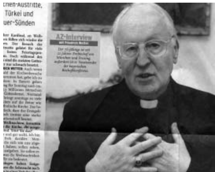
Zeitdokument AZ 24.12.04: Kardinal Wetter schaut unschuldig und verdient mehr als 97 % aller Deutschen!!!

"Seinen Beitrag leisten" - das heißt für die Kirche in Deutschland, nicht nur für die katholische: Jährlich ca. 14 Milliarden an staatlichen Subventionen einstreichen, dazu die Kirchensteuer, dazu die Zuschüsse für die sozialen Leistungen (ca. 10 Mrd.), durch die der Betrieb von kirchlichen Kindergärten, Schulen, Krankenhäusern zu weit über 90 Prozent abgedeckt ist. Der "Beitrag" besteht dann darin, über all dies beharrlich zu schweigen, ein sattes Leben auf Kosten des Steuerzahlers zu führen und sonntags zu Verzicht und Solidarität aufzurufen. "Sie predi-