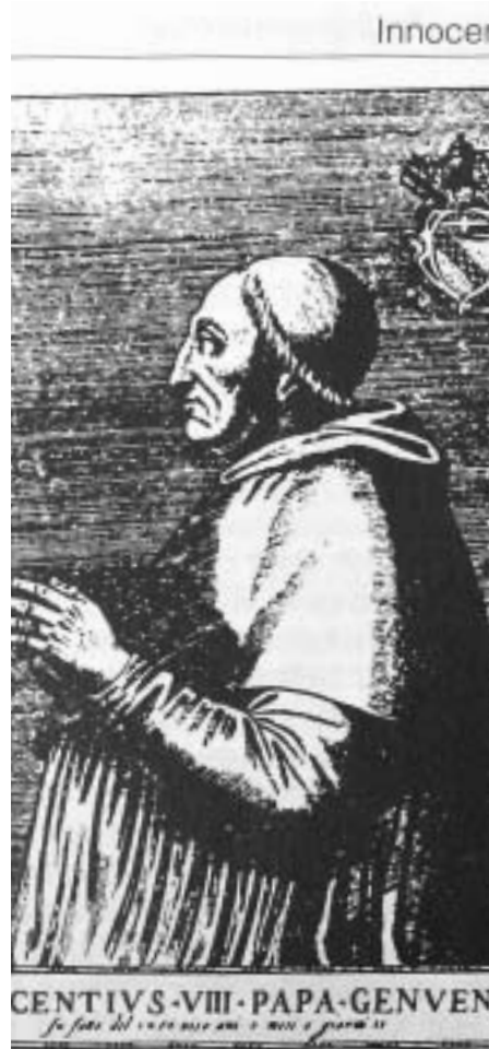
Innozenz der VIII., Herausgeber der „Hexenbulle“ (1484)

Aufgrund der Verpflichtung zu blutsaugerischen Abgaben mussten die Bauern ein Drittel bis die Hälfte über den Eigenbedarf produzieren. Die Kirche trieb unerbittlich den Zehnten ein, sogar vom kärglichen Ährenlesen,