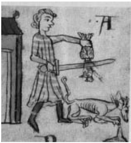
Perverser Irrsinn: Im Mittelalter ließ die Kirche Tiere für Hexerei hinrichten. In Würzburg waren dies im 17. Jhd. mehrere Hundert.

Der Mensch sollte als vernunftbegabtes Wesen und Krone der Schöpfung eigentlich eher der Bewahrer und Schützer der schwächeren Kreatur wie Natur, Pflanzen und Tieren sein, zumal er verstehen sollte, dass er sich durch Raubbau und Missbrauch selbst die Lebensgrundlage seiner eigenen Existenz entzieht.