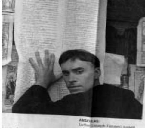
Luther schlägt seine Thesen an.

dass die Schüler eines Tages erfahren, wer Luther wirklich war: ein Hetzer gegen Andersdenkende, der diesen den Henker auf den Hals schickte. Ein Prediger der Gewalt gegen die sozial Unterdrückten, damals die Bauern, zu deren erbarmungsloser Ermordung er aufrief. Ein Verleumder unbescholtener Menschen als "Hexen" und "Zauberer". Ein furchtbarer Antisemit, dessen unflätige Beschimpfungen der Juden zu