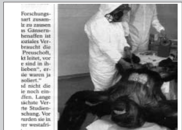
Forschungsart zusammen zu zusehen ist soziales Verhalten, ist leidet, vor e sind in ih lieben", er sie waren ja isoliert." id nicht die ie noch ein ffen. Lange tüchste Ver te Studien schung. Vor rden sie in ter westafri Zeitdokument Spiegel 24.05.04: Grausamste Tierversuche, dienen sie der Medizin?

bloßer Reflex. Diese Weltanschauung wiederum fußt auf der Lehre der Kirche, vertreten z.B. durch Thomas von Aquin, dass Tiere keine unsterbliche Seele haben. Auch Frauen wurde im Mittelalter übrigens die Seele abgesprochen.