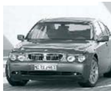
Bischöfe und Kardinäle fahren für gewöhnlich nicht die kleinsten Wägen- auf Kosten der Steuerzahler!

bürger beschimpft, die den Kirchen den Rücken gekehrt haben: